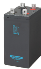
制御弁式据置鉛蓄電池 「MSJ シリーズ」