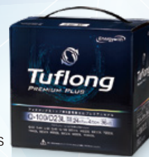
Tuflong PREMIUM PLUS