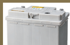
補水不要の液口栓

*4 日本国内の補修市場に流通している自動車用電池において。(当社調べ2022年6月時点)