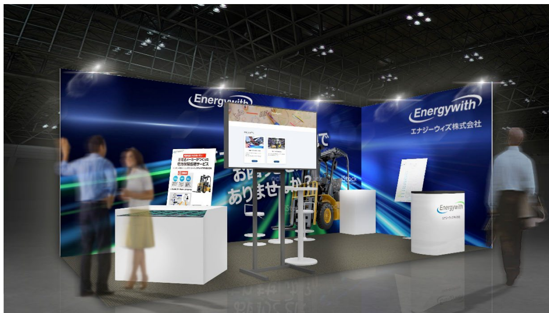
ブース出展場所:6号館 ブース番号 B7-72

*「withBMS」はバッテリーメーカーのエナジーウィズが長年にわたり蓄積してきた技術ノウハウを基盤とした独自の電池状態監視サービスです。