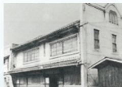
神戸電機製作所設立当時の本社