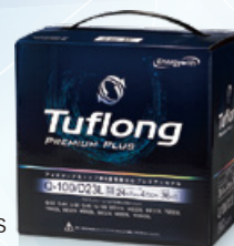
Tuflong PREMIUM PLUS