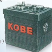
ハイロンバッテリー(1953年)